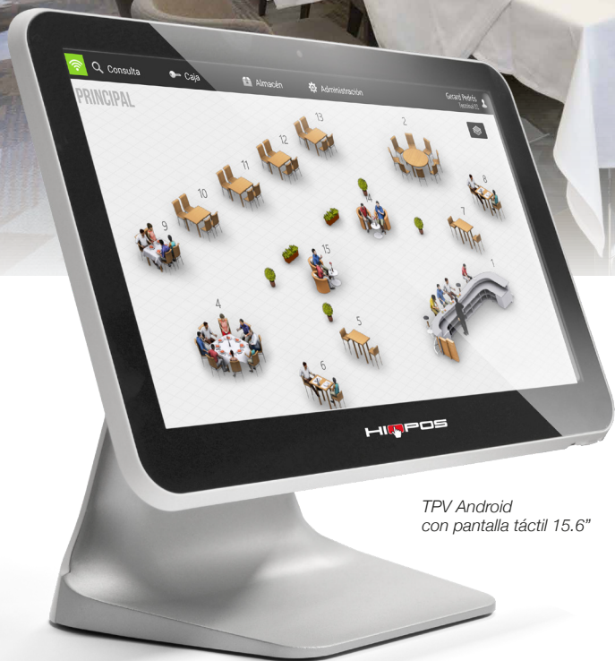
TPV Android con pantalla táctil 15.6"