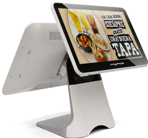
Segunda pantalla de 13.3" (opcional)