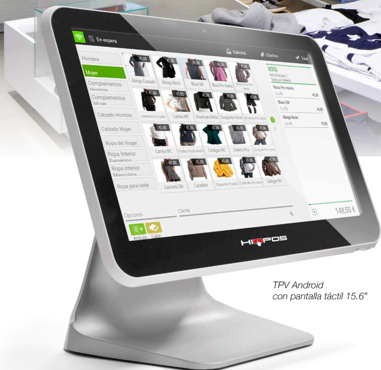
TPV Android con pantalla táctil 15.6"