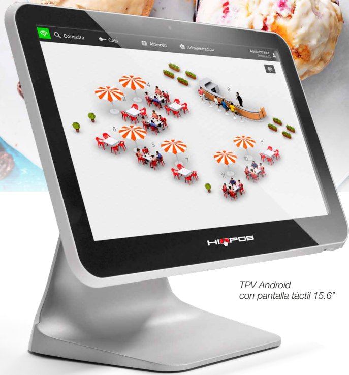
TPV Android con pantalla táctil 15.6"