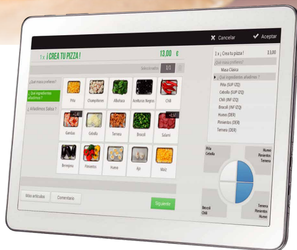
Pizza por porciones