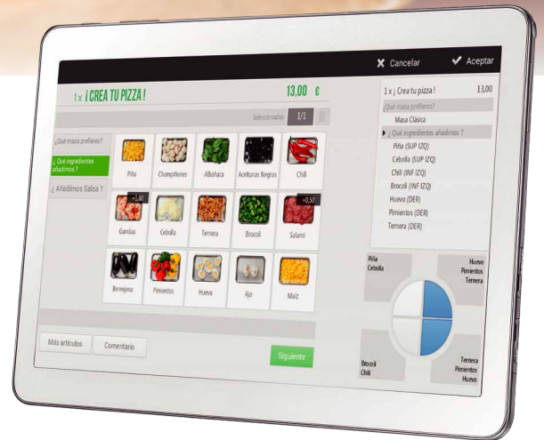
Pizza por porciones