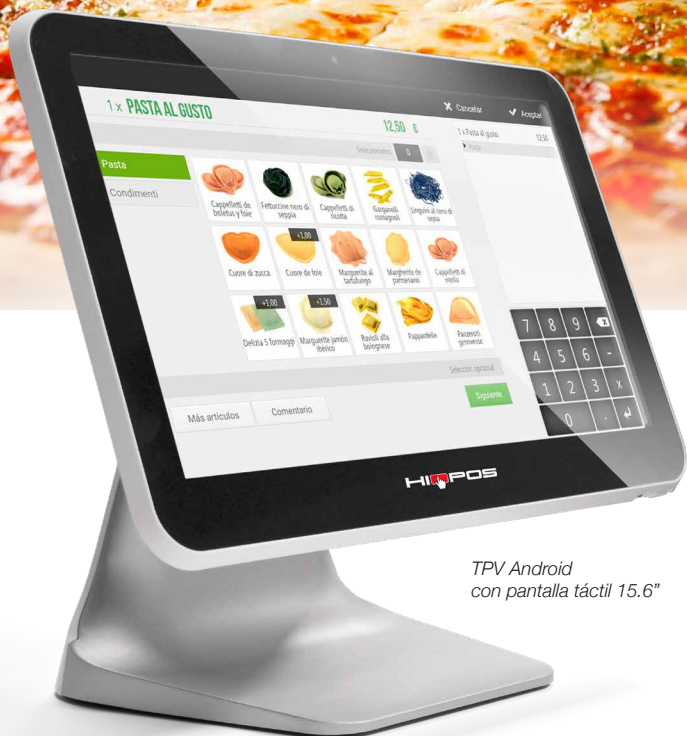
TPV Android con pantalla táctil 15.6"