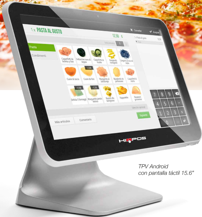
TPV Android con pantalla táctil 15.6"